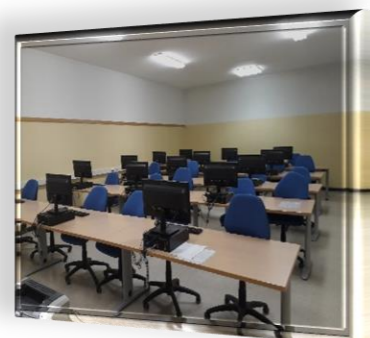
Aula di Informatica