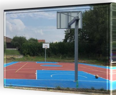
Area esterna polifunzionale