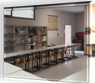
Aula di Arte