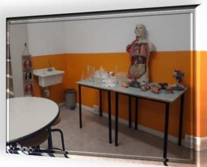
Laboratorio di scienze